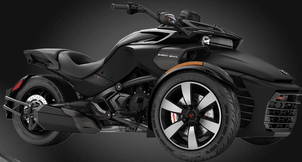
F3-S – Monolith Black Satin