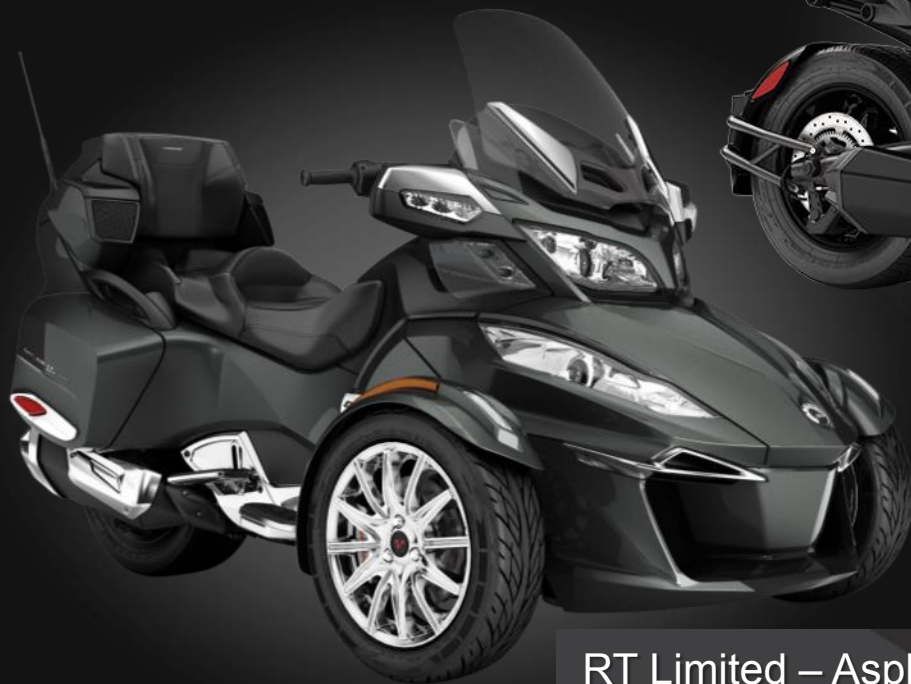
RT Limited – Asphalt Grey Metallic