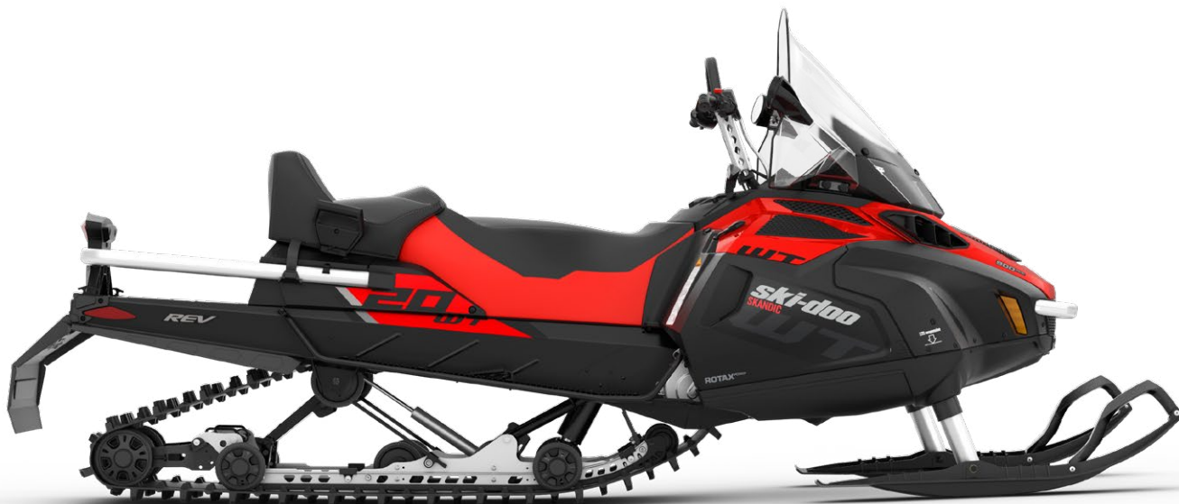
Зображено модель SKANDIC® WT 900 ACE