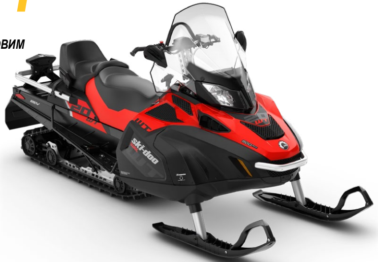
Зображено модель SKANDIC® WT 900 ACE